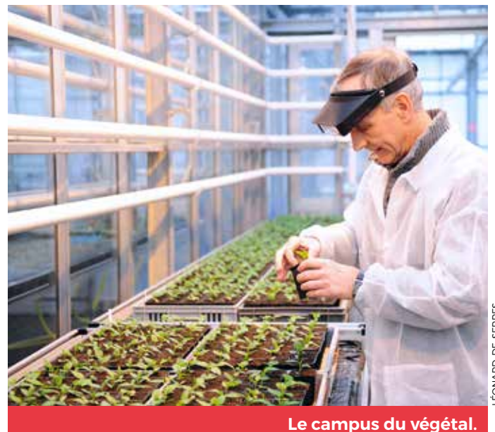
Le campus du végétal.