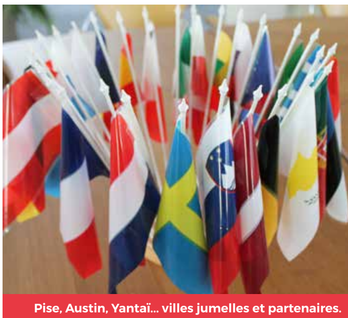
Pise, Austin, Yantai... villes jumelles et partenaires.