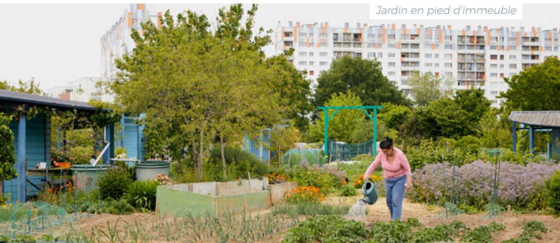
Jardin en pied d'immeuble

À noter : L'association M.A.U.V.E. (mouvement pour une agriculture urbaine vivante et éthique) a pour objet de promouvoir l'agriculture urbaine en Anjou et de sensibiliser le public à ce sujet au travers de différents événements et activités (par exemple : « Les 48h de l'agriculture urbaine »). Elle rassemble de multiples acteurs de l'agriculture urbaine.