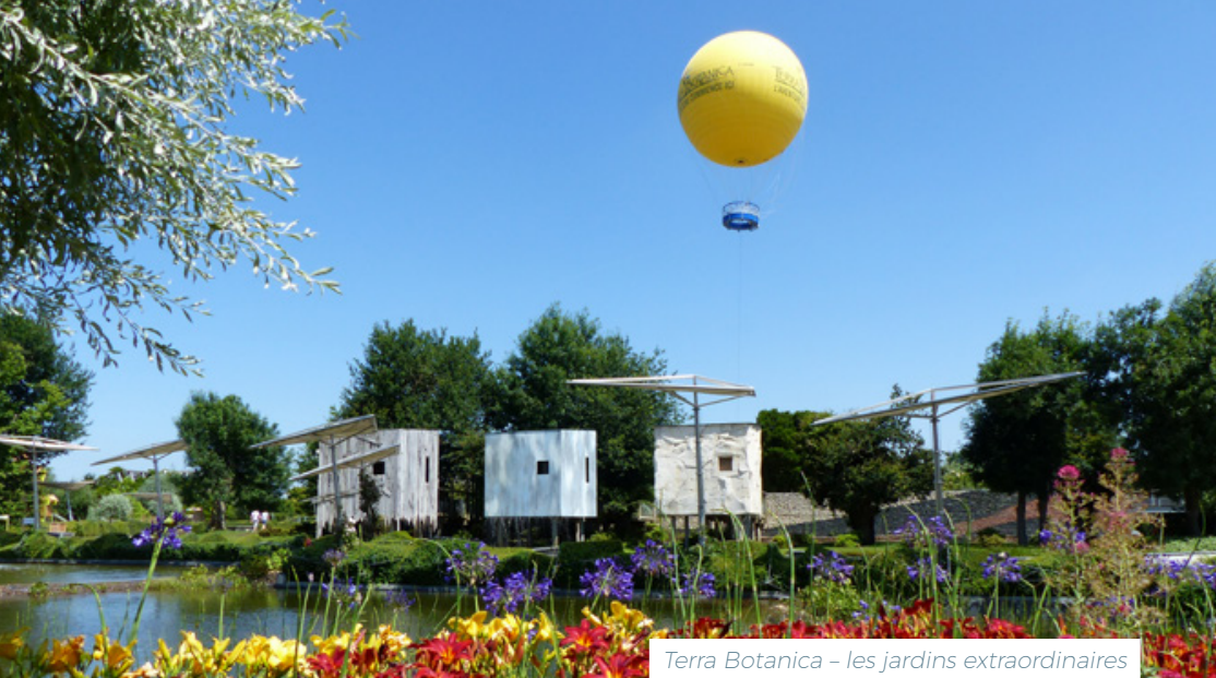
Terra Botanica – les jardins extraordinaires