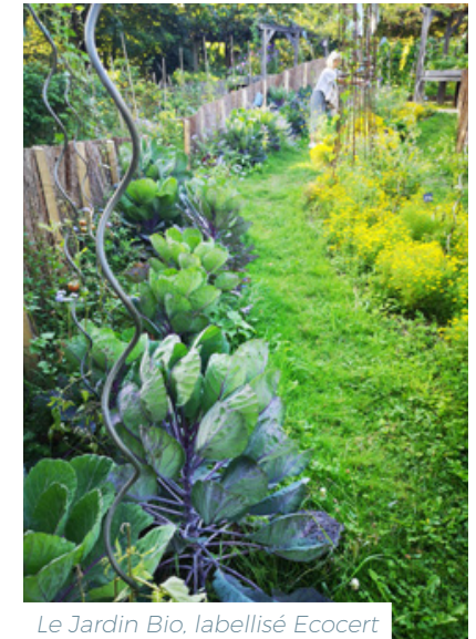
Le Jardin Bio, labellisé Ecocert et refuge LPO (Ligue pour la Protection des Oiseaux)