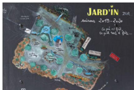
Un « Jard'in ZUR » poétique, collaboratif et expérimental