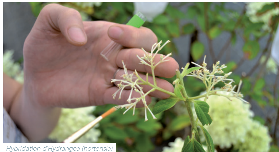
Hybridation d'Hydrangea (hortensia)