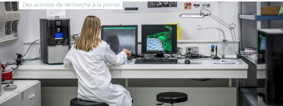
Des activités de recherche à la pointe