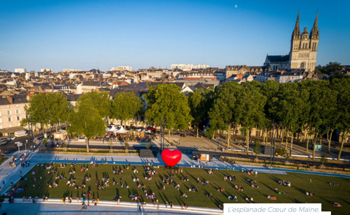
L'esplanade Cœur de Maine, reliant le centre-ville à la rivière