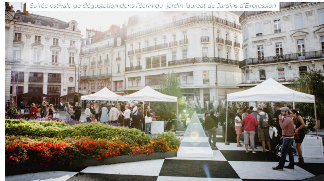
Soirée estivale de dégustation dans l'écrin du jardin lauréat de Jardins d'Expression