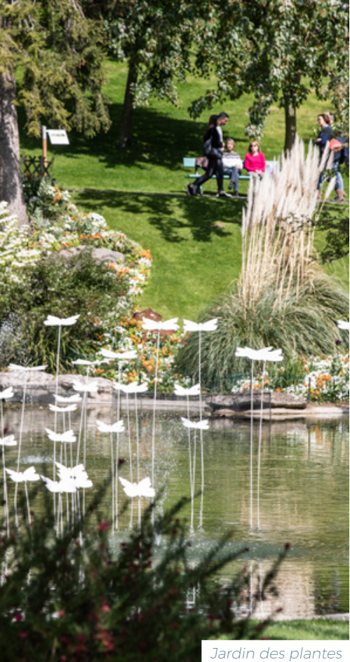
Jardin des plantes