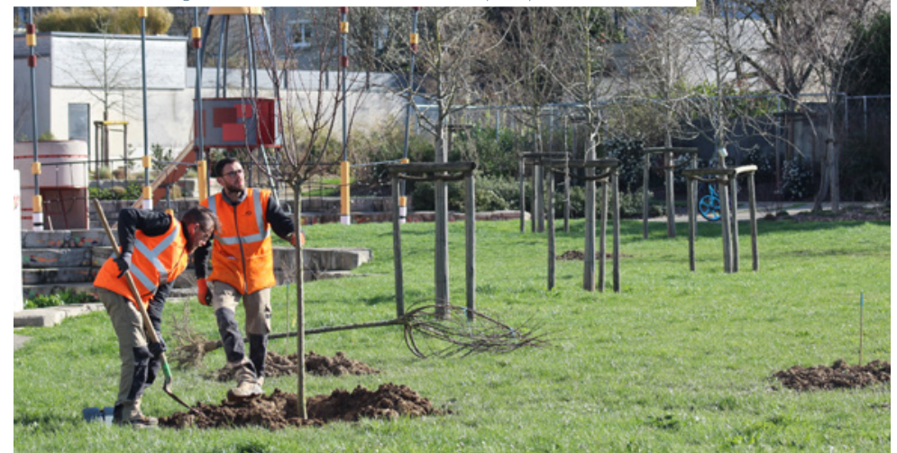
Plantation de vergers en libre cueillette dans chaque quartier de la ville

Tous les ans depuis 2018, la Ville d'Angers consacre 1 million d'euros de son budget investissement à des projets proposés puis choisis par les habitants eux-mêmes. Bon nombre de projets portent sur la nature en ville comme le montrent ces exemples (non exhaustifs) : plantation d'arbres fruitiers avec cueillette en libre-service, création de récupérateurs d'eau, prairies fleuries pour protéger les insectes pollinisateurs, cabane du jardinier urbain, forêts urbaines participatives à la méthode Miyawaki, jardins flottants sur la Maine, etc.