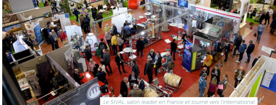
Le SIVAL, salon leader en France et tourné vers l'international

L'Institut national de l'origine et la qualité (INAO), présent via sa délégation Val de Loire, est chargé des signes officiels d'identification des produits agricoles et agroalimentaires.