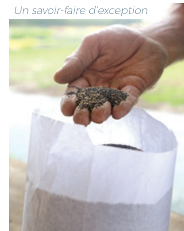
Un savoir-faire d'exception